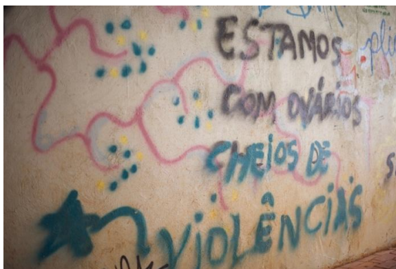
Figura 4.