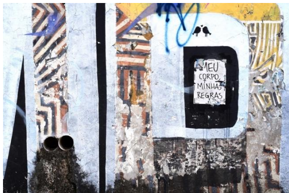
Figura 6. — Fotografia de Gabriela de Freitas.