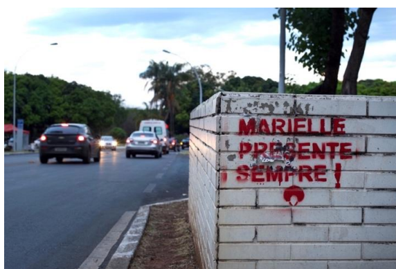
Figura 16. – Fotografia de Gabriela de Freitas.

Encontramos também, por todo plano piloto, pichações, lambe-lambes e estêncil em referência a Marielle Franco, assassinada em março de 2018 por defender os direitos humanos, com ênfase nas mulheres negras e na população LGTBTTQIA+: “Marielle Presente Sempre” (figura 16, referente a um estêncil), dizeres que também tomam os gritos nos protestos feministas Brasil à fora, desde sua morte. O assassinato de Marielle Franco foi um episódio que uniu mulheres em todo país em várias manifestações exigindo justiça nas investigações do caso. Em março de 2019, seus assassinos foram presos. São agentes da polícia militar do Rio de Janeiro com supostas ligações anteriores com membros da família do atual presidente da república. No entanto, mesmo transcorridos mais de mil dias após o assassinato, os presos não foram julgados e as investigações ainda não encontraram os responsáveis pela articulação política que levou ao crime.