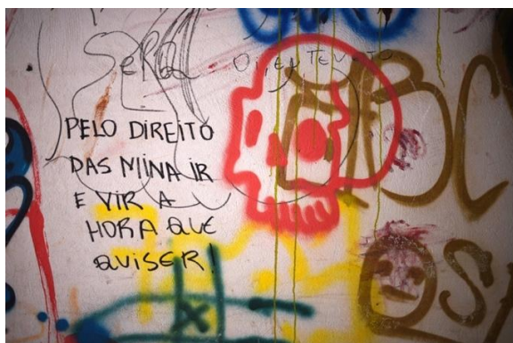
Figura 2. — Fotografia de Gabriela de Freitas.

são bem características de pichações urbanas, geralmente sem um design mais elaborado. Quando for o caso, destacaremos o uso de outras técnicas como lambe-lambes ou estêncil.