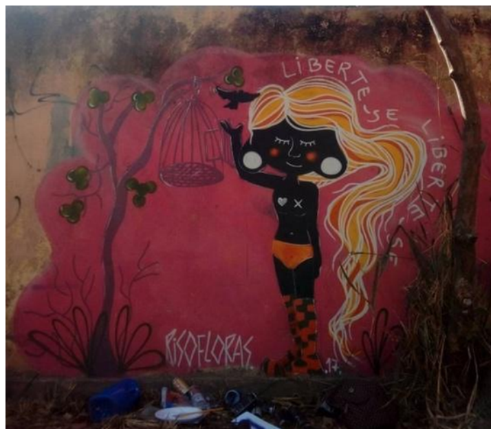
Figura 18. — Intervenção realizada pelo coletivo RisoFloras na Asa Norte, Brasília.