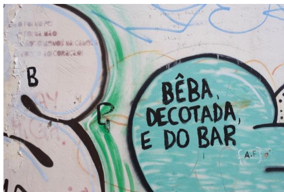
Figura 10. — Fotografia de Gabriela de Freitas.