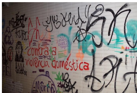
Figura 5.