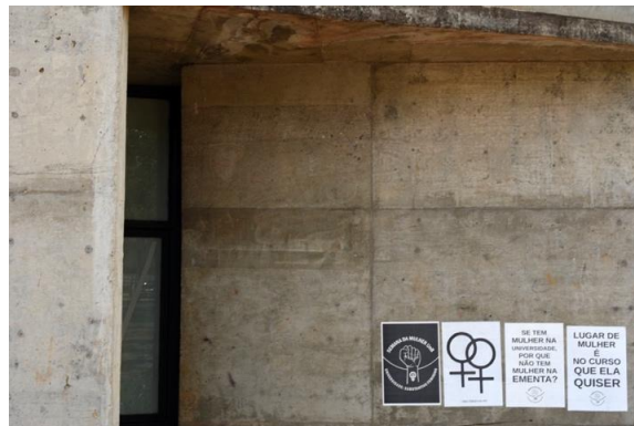
Figura 15.