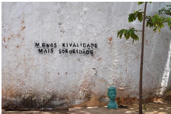
Figura 14. – Fotografia de Gabriela de Freitas.

muitas vezes representadas nas escolhas das ementas por parte de professores e até mesmo professoras. Nesse sentido, encontramos pelo campus da universidade um cartaz tipo lambe-lambe com os seguintes dizeres: “Se tem mulher na universidade, por que não tem mulher na ementa?” (figura 15).