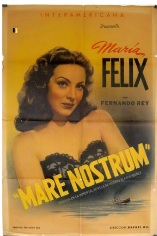
Figura 1. — Cartel de la película Mare Nostrum .

Este truco ilusionista se realiza mediante el personaje de la mujer fatal, de la vampiresa, sobre la cual recae la responsabilidad entera de la tentación, cuando el ejemplar Ferragut consigue redimirse de su pecado, liberado, por la narración y la puesta en escena, de cualquier responsabilidad en el asunto.